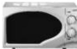
microwave oven Ad6202