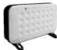
convection heater Ad7501