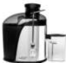
juice extractor Ad4103