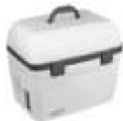
portable cooler Ad806