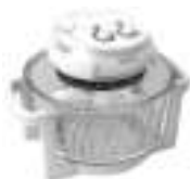
convection oven Ad6304