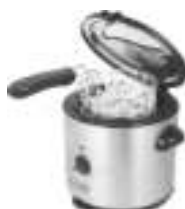
deep fryer Ad4901