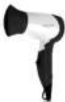
hair dryer Ad2230