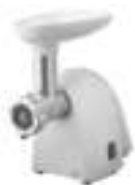
meat mincer Ad48