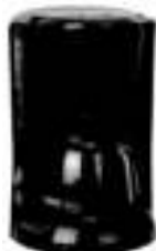
coffee maker Ad4451