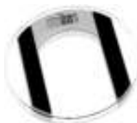
bathroom scale Ad8122