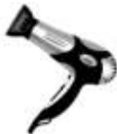
hair dryer Ad2224