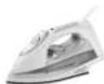
steam iron Ad5014