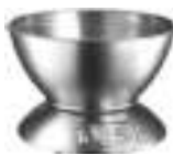
kitchen scale Ad3134