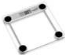
bathroom scale Ad8121