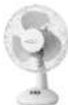
table fan Ad7302