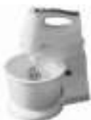
mixer with bowl Ad43