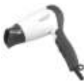
hair dryer Ad2228