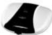
waffle maker Ad3017