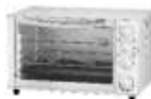
electric oven Ad6001