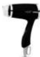
hair dryer Ad2232