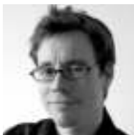
Design by Fabian Zimmerli

Thanks to all people involved in this project: Barry Huang for his engagement and organization, Jerry Lee with Shen Yongjiu for the main engineering and Shu Hebo for his CAD work, Mario Rothenbühler for the photos, Fabian Zimmerli for the unique idea and design, Matti Walker for the graphic work.