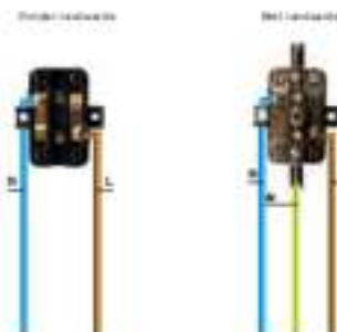
Wandcontactdoos (dubbel) Met/zonder randaarde

Wandcontactdoos voor montage op de muur om apparaten, lampen en verlengsnoeren op het elektriciteitsnet aan te sluiten.