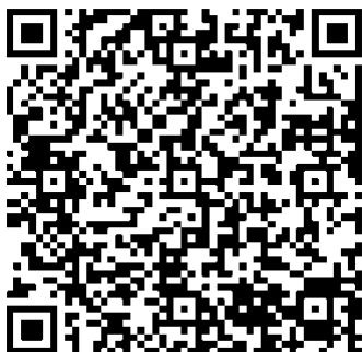
(Android QR Code)