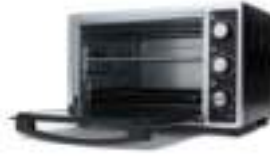
Electric Oven CR 6018