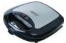
Electric Grill CR 3024