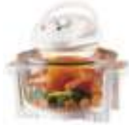
Halogen Oven CR 6305