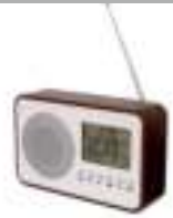
Radio CR 1153