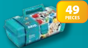
34586 Builder Starter Set