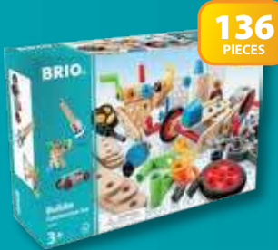
34587 Builder Construction Set