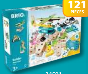
34591 Builder Motor Set

WARNING! Not suitable for children under 3 years due to small parts. Choking hazard! ADVARSEL! Uegnet for barn under 3 år på grunn av små deler. Kvelningsfare! VAROITUS! Ei soveltu alle 3-vuotiaalle lapsille. Sisältää pieniä osia. Tukehtumisvaara! ADVARSEL! Ikke egnet for børn under 3 år pga. smådele. Kvælningsfare! VARNING! Inte lämplig för barn under 3 år pga. små delar. Kvävningensrisk! ATTENTION! Ne convient pas aux enfants de moins de 3 ans - contient des petits éléments. Risque d'étouffement! ¡AVISO! No adecuado para niños menores de 3 años porque contiene piezas pequeñas. Riesgo de asfixia! ACHTUNG! Wegen der kleinen Teile nicht für Kinder unter drei Jahren geeignet. Erstickungsgefahr! ATTENZIONE! Non adatto a bambini al di sotto di 3 anni a causa della presenza di piccole parti. Rischio di soffocamento! WAARSCHUWING! Met het oog op kleine onderdelen niet geschikt voor kinderen tot 3 jaar. Verstikkingsgevaar! ADVERTÊNCIA! Não adequado para crianças com menos de 3 anos porque contém peças pequenas. Risco de asfixia! VAROVÁNÍ! Z důvodu malých součástí nie je vhodné pre deti mladšie ako 3 roky. Riziko udusení! VAROVÁNÍ! Nevhodné pro děti do 3 let - obsahuje drobné součásti. Nebezpečí udušení! 注意! 誤飲の危険がありますので、3才未満のお子様には絶対に与えないで下さい。窒息などの危険があります。