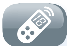
Télécommande avec écran de contrôle LCD