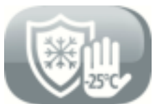
Protection antigel de l'unité extérieure