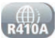
Réfrigérant respectueux de l'environnement