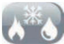
Fonctions 3 en 1

Cette fonction pour économiser de l'énergie, permet à l'appareil de rester en mode standby et de consommer seulement 1watt.