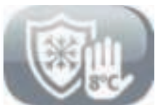
Fonction hors gel