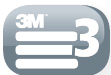
3-couches de filtre