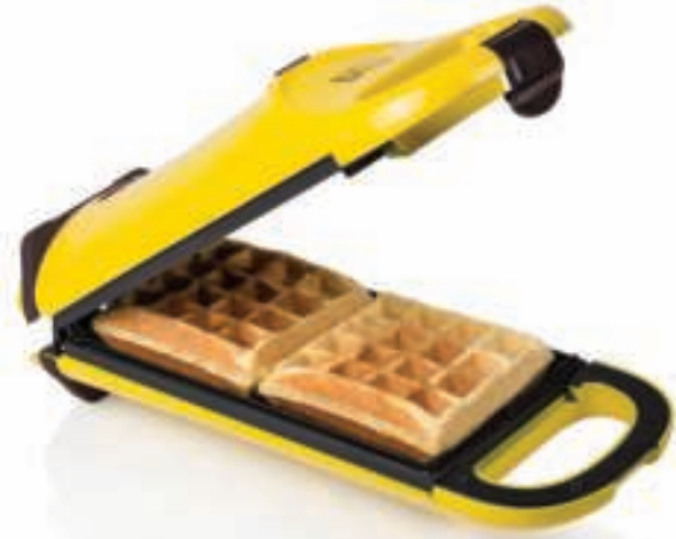
Waffle Maker 01.132400.01.001

PARTS DESCRIPTION / ONDERDELENBESCHRIJVING / DESCRIPTION DES PIÈCES / TEILEBESCHREIBUNG / DESCRIPCIÓN DE LAS PIEZAS / DESCRIZIONE DELLE PARTI / DOS COMPONENTES / OPIS CZĘŚCI / DESCRIZIONE DELLE PARTI / BESKRIVNING AV DELAR / POPIS SOUČÁSTÍ / POPIS SOČÁSTI