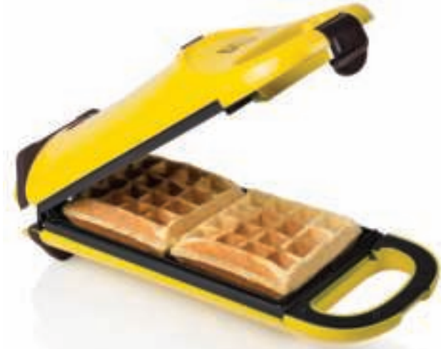
Waffle Maker 01.132400.01.001

PARTS DESCRIPTION / ONDERDELENBESCHRIJVING / DESCRIPTION DES PIÈCES / TEILEBESCHREIBUNG / DESCRIPCIÓN DE LAS PIEZAS / DESCRICÃO DOS COMPONENTES / OPIS CZĘŚCI / DESCRIZIONE DELLE PARTI / BESKRIVNING AV DELAR / POPIS SOUČÁSTÍ / POPIS SOUČASTI