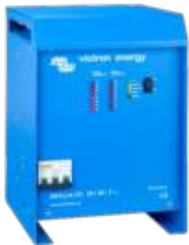
Skylla TG 24 50 3 phase

In ons boek 'Altijd Stroom' kunt u meer lezen over accu's en het laden van accu's (gratis verkrijgbaar bij Victron Energy en beschikbaar op www.victronenergy.com ).