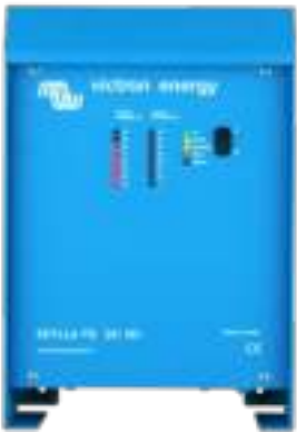
Skylla TG 24 50