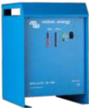
Skylla TG 24 100