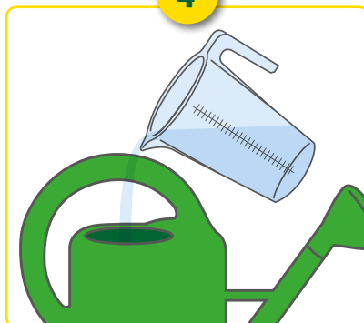
Verdeel het concentraat.