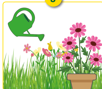
Giet of sprei over gazon, siertuin, blad, boom of in potten.