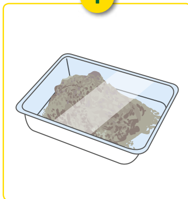
Bakje met aaltjes.