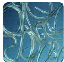
Aaltjes 400x vergroot

Bij een bodemtoepassing van aaltjes vermenigvuldigen de aaltjes zich in het plaaginsect. Ze zorgen zo voor een nieuwe generatie aaltjes die vervolgens op zoek gaat naar de rest van de plaaginsecten. Hoe beter aaltjes zich kunnen verspreiden, hoe effectiever de werking. Overdoseren is geen probleem. De hoeveelheid aaltjes neemt pas af als de plaag niet meer aanwezig is, de bodem te droog wordt of wanneer de bodem- of omgevingstemperatuur te laag wordt.