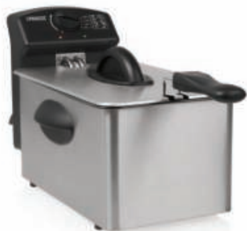
Deep Fryer 01.182642.01.001

PARTS DESCRIPTION / ONDERDELENBESCHRIJVING / DESCRIPTION DES PIÈCES / TEILEBESCHREIBUNG / DESCRIPCIÓN DE LAS PIEZAS / DESCRICÃO DOS COMPONENTES / DESCRIZIONE DELLE PARTI / BESKRIVNING AV DELAR / OPIS CZĘŚCI / POPIS SOUČÁSTÍ / POPIS SUČASTI / ОПИСАНИЕ ЗАПЧАСТЫ