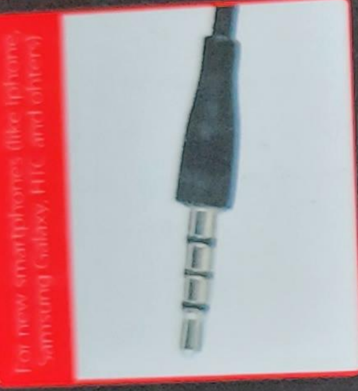
For new smartphones like iPhone Samsung Galaxy HTC and others