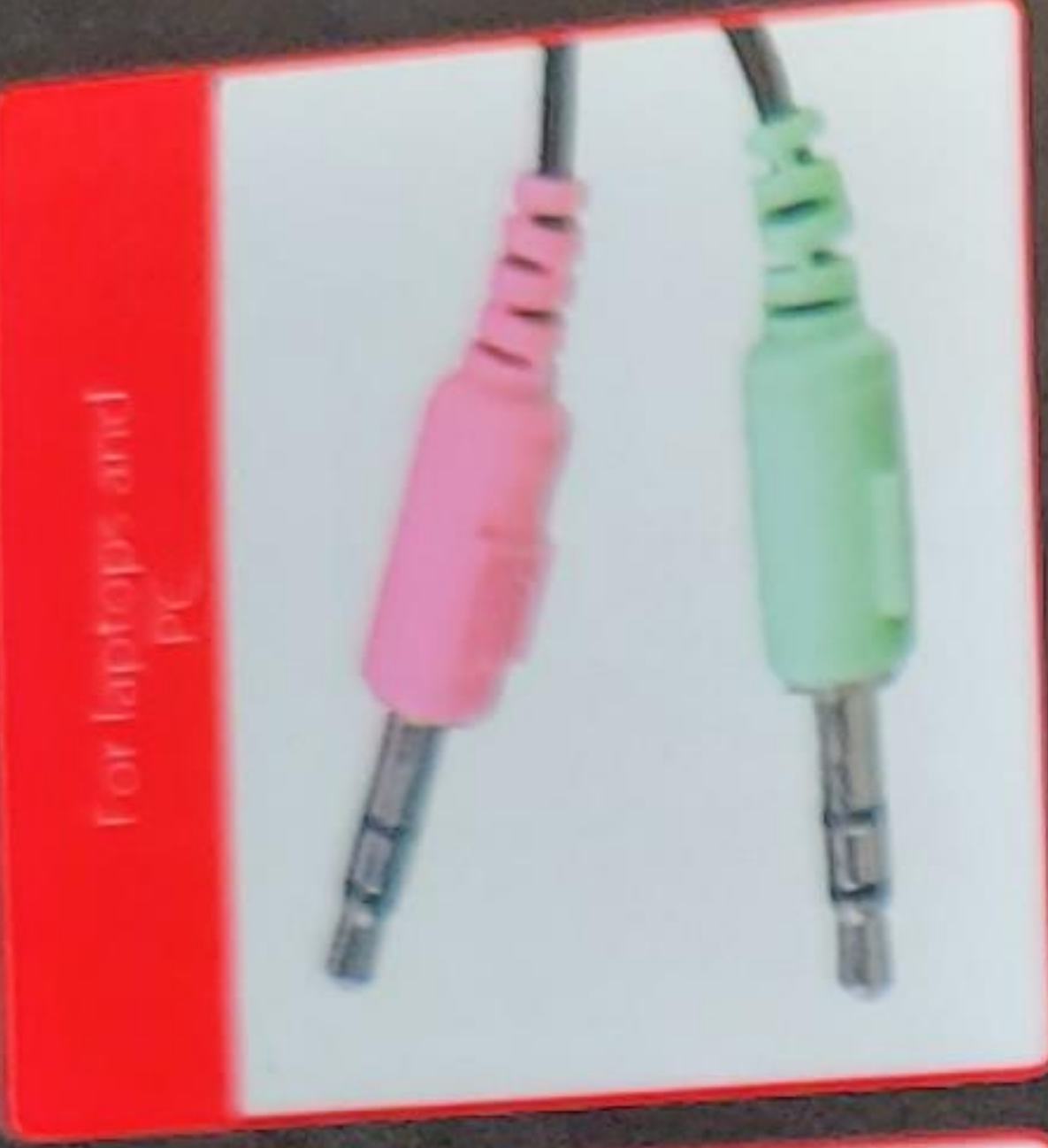
For laptops and PC