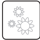
Andere geur van de ontlasting