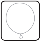
Verhoogde flatulentie, (winderigheid), tijdens de eerste dagen van gebruik

Er zijn verschillende indicatoren die wijzen op de werking van DETOXNER® PDS ONDERHOUD. Niet alle indicatoren zijn even aangenaam. Zij zijn echter verbonden aan het zuiverende effect op het darmsysteem en zijn slechts tijdelijk (voor de duur van het programma).