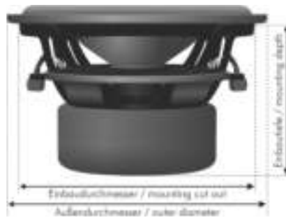
symbolische Darstellung symbolic illustration