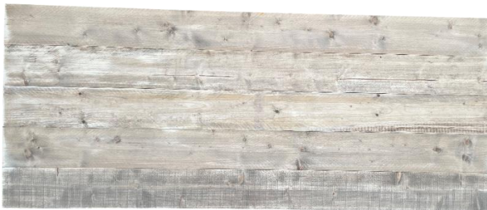
1 x bureaublad.

In de poten, maar niet in het blad, zodat u de poten naar eigen inzicht kunt monteren.