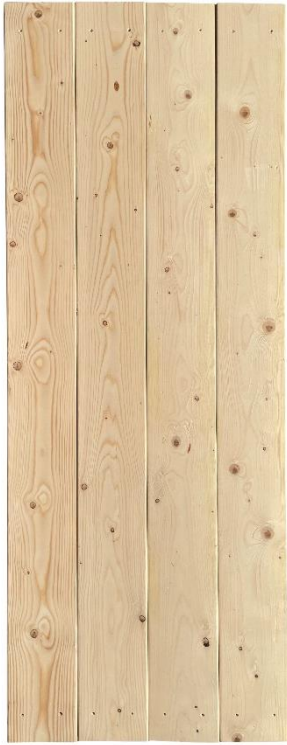
4 voorgeboorde planken (18,5 x 200 cm)