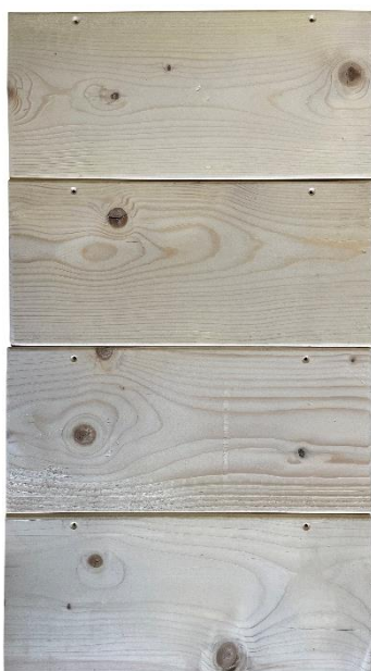
4 voorgeboorde planken (18,5 x 42 cm)