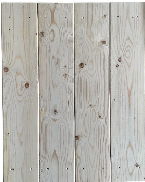
4 voorgeboorde planken (18,5 x 90 cm)