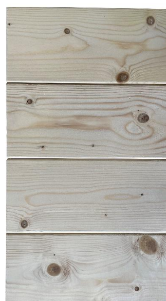
4 planken (18,5 x 42 cm)