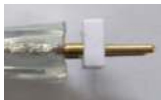
Vista lateral tras asegurar el conector de 2 pines

Asegurar primero el conector de 2 pines a la tira. Prestar atención ya que los dos pines deben tocar firmemente a los dos conductores de la tira.