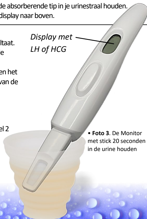
Foto 3. De Monitor met stick 20 seconden in de urine houden

Stap 5. Verwijder de teststick uit de Monitor door op de witte eject-knop te duwen. De stick mag bij het huishoudelijk afval. De Monitor mag worden opgeborgen tot de volgende test.