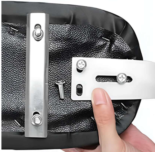
Step 1. Loosen the 3 bolts in the seat. Fix the backrest with the loosened bolts.