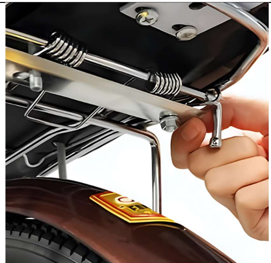
Step 4. Replace the metal bars and tighten the nuts firmly.