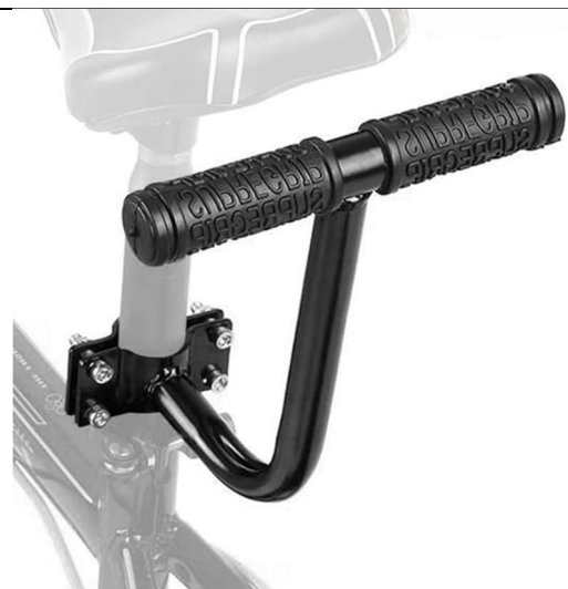
Step 6: Attach the armrest to the seat post with the bolts and nuts provided. Tighten these securely.