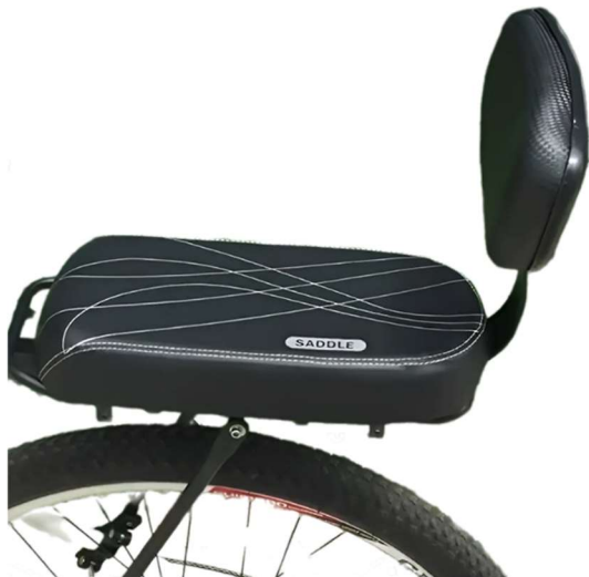
Step 3. Place the seat in the correct position on the carrier.