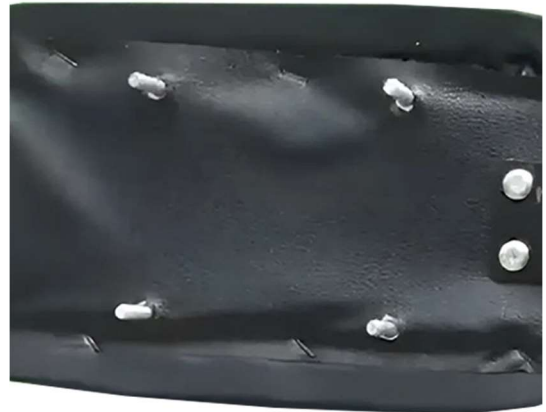
Step 2. Remove the metal bars from the seat.