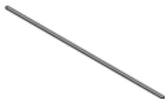
C. 2X X BAR