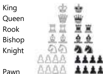
Basic set-up of the board