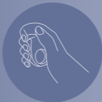
Hoe je hem vasthoudt