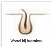
Wortel bij haaruitval

HairGro Hair Booster Serum: stimuleert krachtig nieuwe haargroei bij plaatselijk dunner wordend haar.