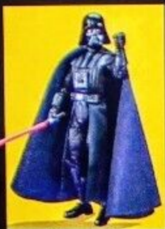
*DARTH VADER (THE DARK TIMES)*