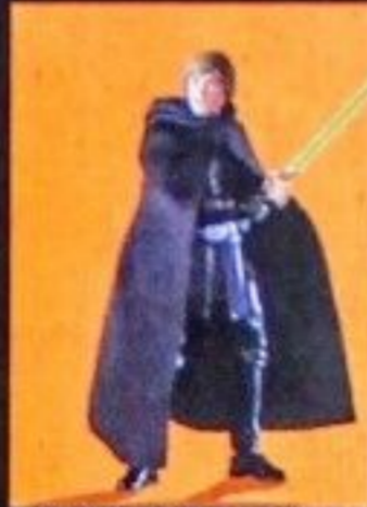
*LUKE SKYWALKER (IMPERIAL LIGHT CRUISER)*