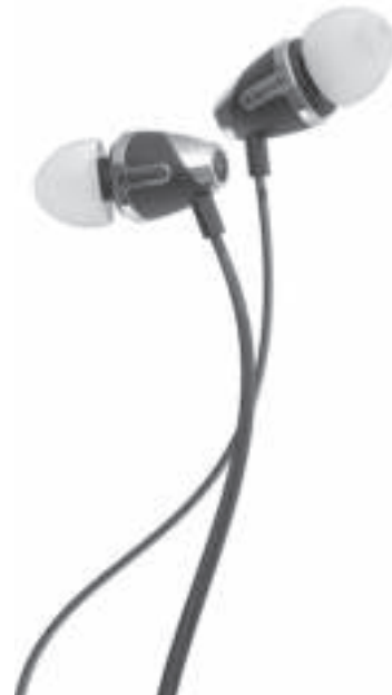
Image S4 Headphones