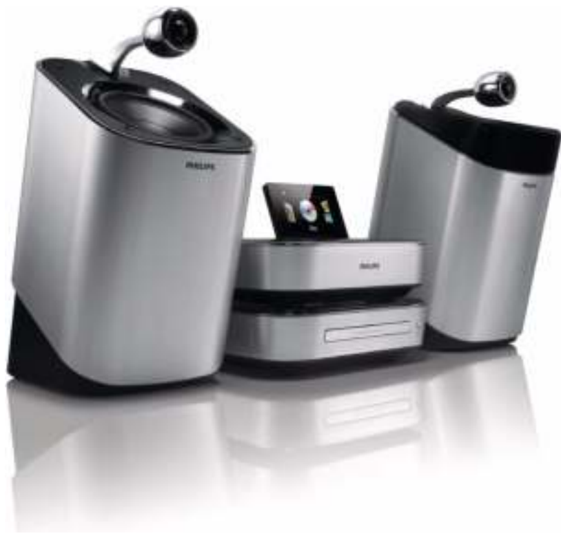
Philips Chaîne hi-fi DVD