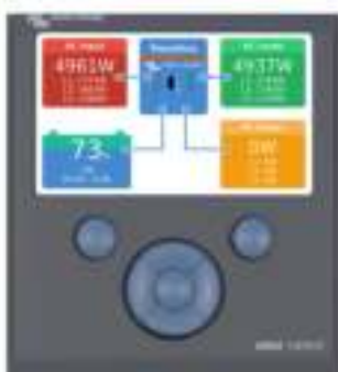
Color Control GX met een PV-toepassing

Indien aangesloten op het Ethernet zijn systemen met een Color Control GX en andere GX apparaten toegankelijk en kunnen instellingen worden gewijzigd.