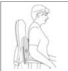
Rugmassage: onderste gedeelte van de rug (lende-wervels)