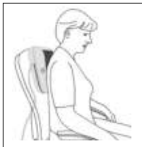
Rugmassage: bovenste gedeelte van de rug