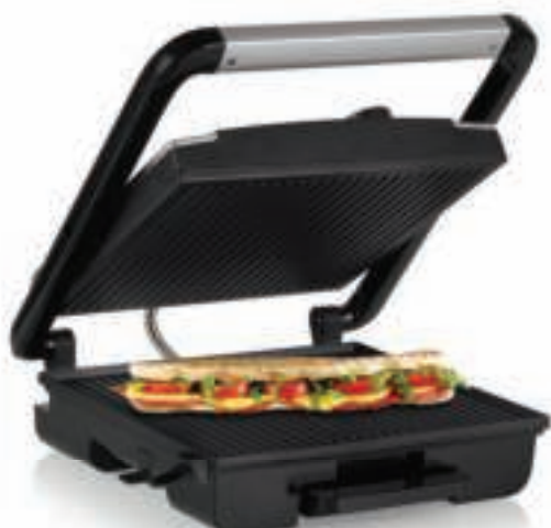
Panini Grill Pro 01.112425.01.001

EN Instruction manual NL Gebruiksaanwijzing FR Mode d'emploi DE Bedienungsanleitung ES Manual de usuario PT Manual de utilizador IT Manuale utente SV Bruksanvisning PL Instrukcja obsługi CS Návod na použití SK Návod na použitie RU Руководство по эксплуатации