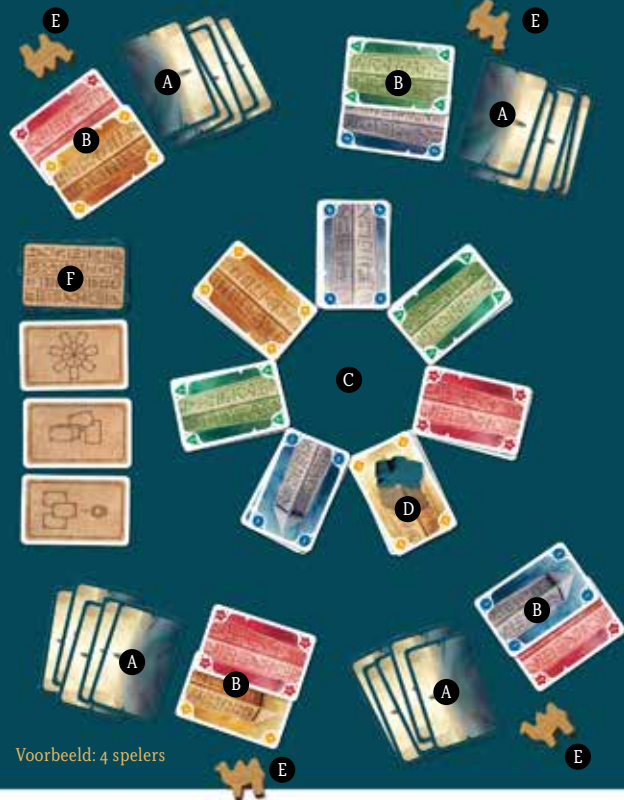
Voorbeeld: 4 spelers

De oudste speler begint. Daarna zijn, met de klok mee, de volgende spelers aan de beurt.