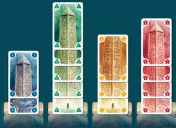
Voorbeeld: 4 obeliskken

Let op! Houd er bij het bouwen rekening mee dat je ook minimaal 1 kaart in je persoonlijke markt moet leggen.