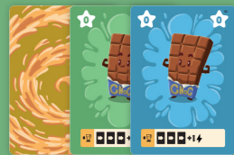
60 ingrediëntkaarten basis decks (groen & blauw)

Mix de juiste ingrediënten, maak impactvolle combo's en verpletter je tegenstander tot pulp in dit smoothie-duel!