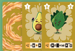
24 ingrediëntkaarten geavanceerd deck (geel)