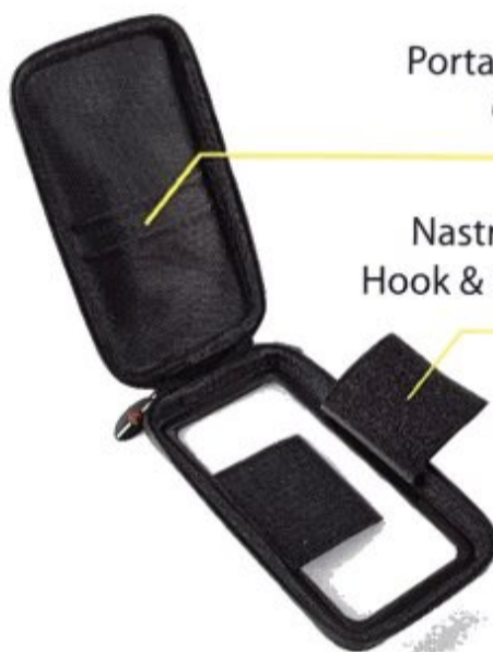
Porta documenti Card holder