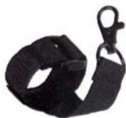
Laccio di sicurezza Safety lace