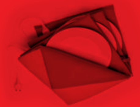
Plate Warmer MAXI GOURMET Solis