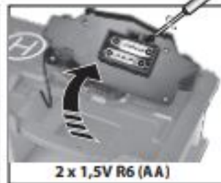
2 x 1,5V R6 (AA)

D: Batterien nur für Testzwecke enthalten. GB: Batteries are for demonstration purposes only. F: Les piles sont fournies pour la démonstration uniquement. E: Pile contenute a solo scopo dimostrativo. NL: Batterijen zitten er alleen in om te testen. E: Las pilas contenidas sólo sirven para comprobar el funcionamiento. P: Pilhas contidas só para fins de apresentação. DK: Batterierne er kun til demonstrationsbrug. S: Medföljande batterier är endast för teständamål. FIN: Sisältää paristot ainoastaan kokelutarkoitukseseen. N: Inneholder kun batterier for test. H: Az elemek csak bemutatói célra szolgálnak. CZ: Obsahuje baterie jen pro testovací spuštění. PL: Baterie tylko do celów demonstracyjnych. GR: Περιέχει μπαταρίες μόνο για δοκιμαστικούς σκοπούς. TR: İçindeki piller yalnızca deneme amaçlıdır. SI: Vsebuje baterije, ki so izključno namenjene testiranju. HRV: Sadržî baterije isključivo u svrhu testiranja. SK: Batérie sú súčasťou len pre testovacie účely. BG: Батериите са само с пробна цел. RO: Bateriile sunt conținute numai în scop de testare. UA: Батареїки встановлено виключно для перевірки іграшки. EST: Patareid on kaasas ainult testimiseks. LT: Baterijos priedamos tik testavimui. LV: Baterijas ir tikai testa nolūkam. AR: البطاريات للإتراضى طرح اللعبة فقط.