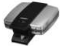
Brüsseler Waffelautomat 1445