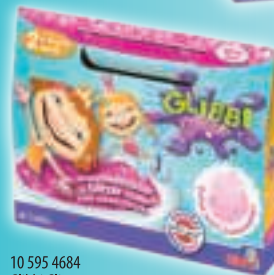
10 595 4684 Glibbi Glitter