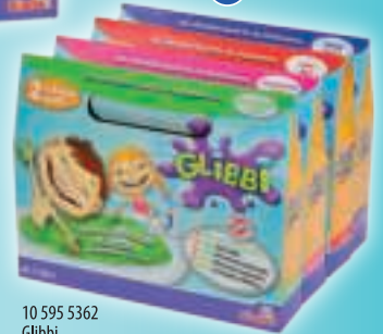
10 595 5362 Glibbi