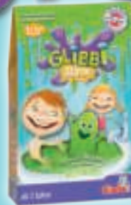
10 595 4666 Glibbi Slime

Glibbi Standard ist in diesen Farben erhältlich: