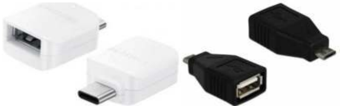
Oude Androids (Micro USB naar USB Female)

Voor het aansluiten van de Digitale USB Microscoop aan uw smartphone heeft u een koppelstuk nodig. Kijk goed welke aansluiting uw smartphone heeft zodat u de juiste koppelstuk kunt bestellen.