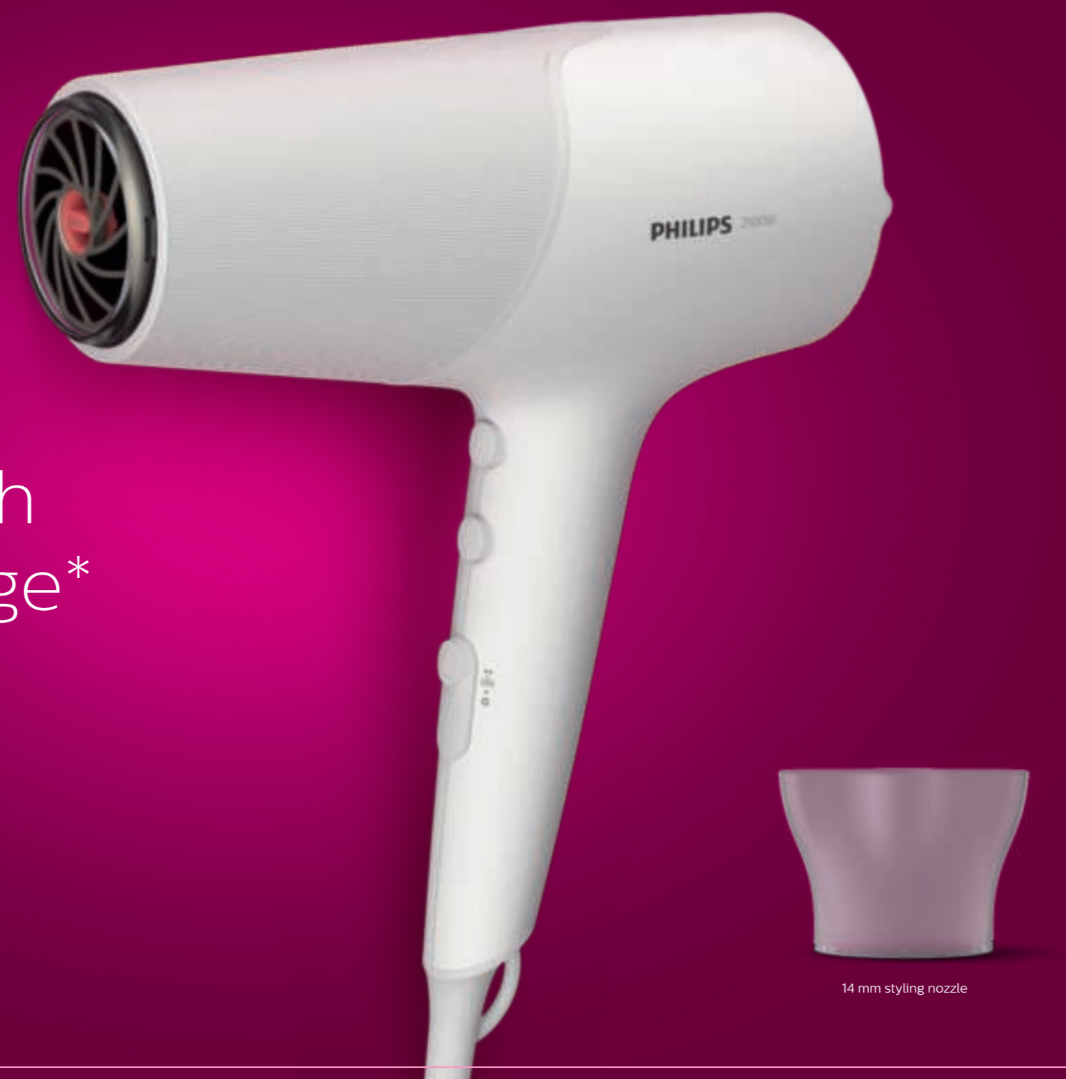
14 mm styling nozzle