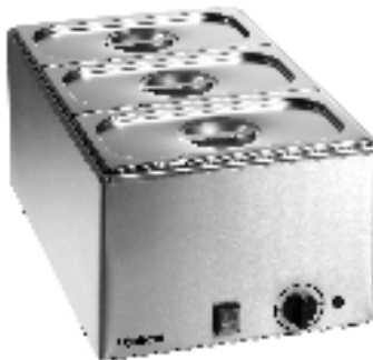
200.233 3 x 1/3 GN