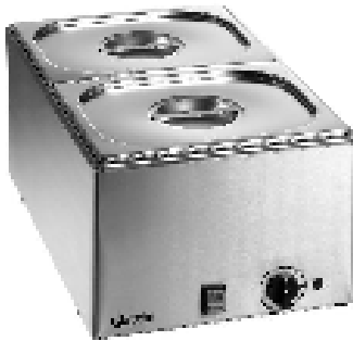
200.232 2 x 1/2 GN