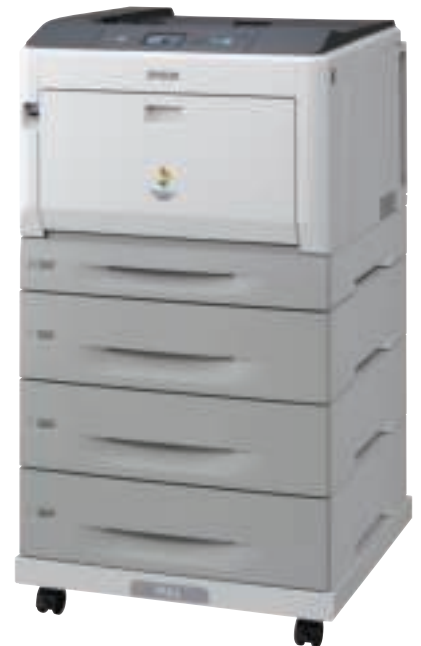
Getoonde model: AL-C9300D3TNC met mogelijkheid voor dubbelzijdig afdrucken, 3 extra papierladen en printeropzetelement