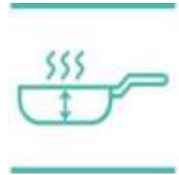
Diepere pan voor meer veelzijdigheid

Deze pan is geschikt voor gebruik in de oven tot 210°C. Hiermee kun je nog meer uit je pan halen!