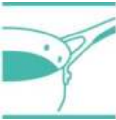
Geklonken RVS handgreep voor veilige grip.

De Thermo-Signal™ in de bodem van de pan geeft aan wanneer de ideale baktemperatuur is bereikt. Op deze temperatuur blijven texturen, kleuren en smaken behouden. Voor heerlijke, smaakvolle maaltijden, elke dag weer!