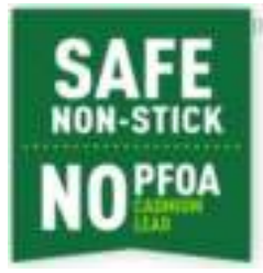
Veilige titanium coating

Stijlvolle roestvrijstalen pan die er net zo goed uitziet als hij kookt - perfect om op tafel uit te dinen. De pan heeft niet alleen een titanium coating, waardoor ingrediënten niet aanbakken, hij is ook super duurzaam en bestand tegen stoten.