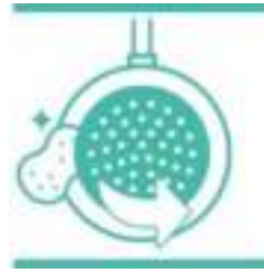
Superieure titanium coating

0% PFOA, 0% lood, 0% cadmium* * Strengere controles dan die vereist worden door de huidige regelgeving rondom contact met levensmiddelen. Product bevat geen lood of Cadmium (geen Pb, geen Cd), ook niet in de antiaanbaklaag. Geen migratie op een meetniveau van 0,005 mg/kg.