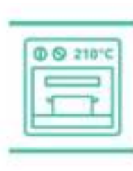
Ovenbestendig tot 210°C

Dankzij de Thermo-Fusion™ technologie wordt de pan snel warm en wordt deze warmte evenredig verspreid. Zo krijg je gelijkmatige bereidingen.