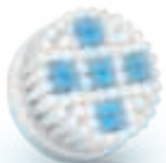
DEEP PORE Cleansing brush head (SC5996)

2 Special needs and care / Soins et besoins spécifiques / Necessità e cure speciali / Speciale behoeften en verzorging / Особый уход и забота