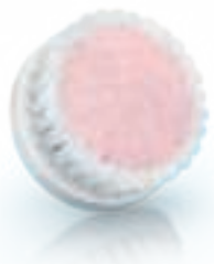
EXTRA SENSITIVE brush head (SC5993)

2 Special needs and care / Soins et besoins spécifiques / Necessità e cure speciali / Speciale behoeften en verzorging / Особый уход и забота