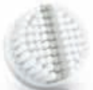
EXFOLIATION brush head (SC5992)

3 Weekly exfoliation / Exfoliation hebdomadaire / Esfoliazione settimanale / Wekelijkse scrub / Ежедневный пилинг