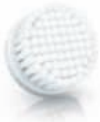
NORMAL brush head (SC5990)