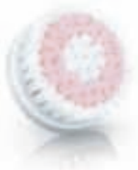
SENSITIVE brush head (SC5991)