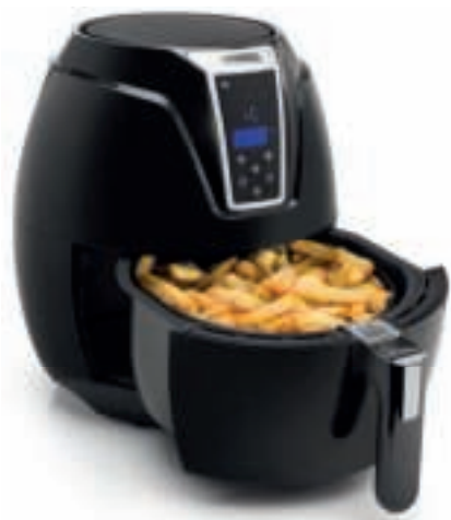
Digital Aerofryer XL 01.182021.01.001