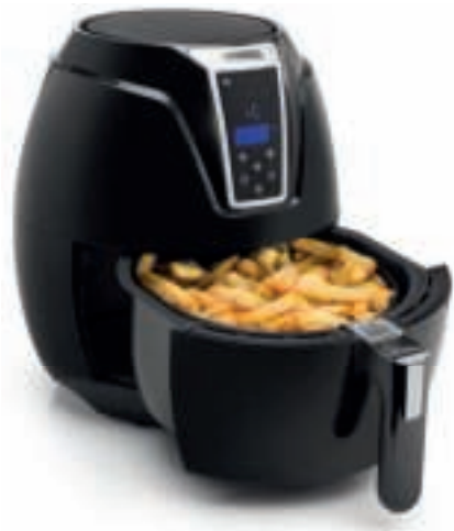
Digital Aerofryer XL 01.182021.01.001