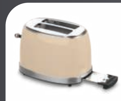
Bandeja recogemigas extraíble Easily removable Crumb tray Plateau ramasse-miettes amovible Bandeja de migalhas removível Abnehmbare Krümelschublade Vassoio raccogli briciole rimovibile