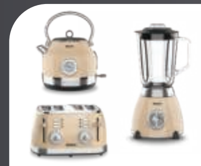
Productos Serie Retro Retro Serie products Produits de la Série Retro Produtos da Série Retro Produkte der Retro-Serie Prodotti della Serie Retro