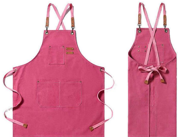
Werkschort 75 x 68 cm