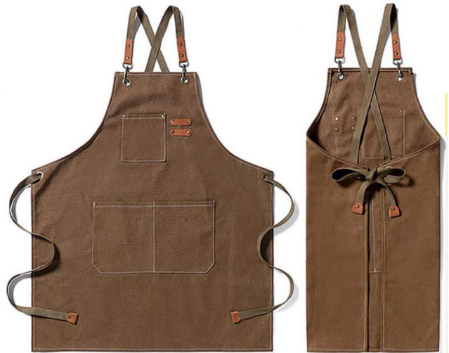
Werkschort 75 x 68 cm