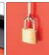
system zabezpieczający przed kradzieżą