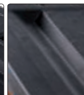
rowek przydatny podczas wiercenia lub wkręcania