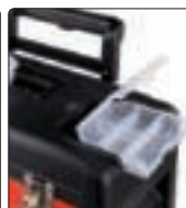
dwa wyjmowane organizery