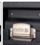
metalowe zapięcia łączące moduły