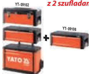
Zestaw 4-modułowy z 2 szufladami

MOŻLIWOŚĆ INDYWIDUALNEGO SKOMPONOWANIA ZESTAWU