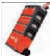
kółka i teleskopowa rączka