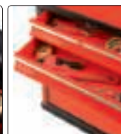
szuflady na prowadnicach z łożyskami kulkowymi