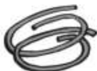
2x kort faux suede