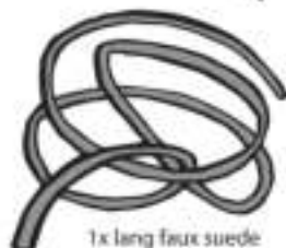
1x lang faux suede