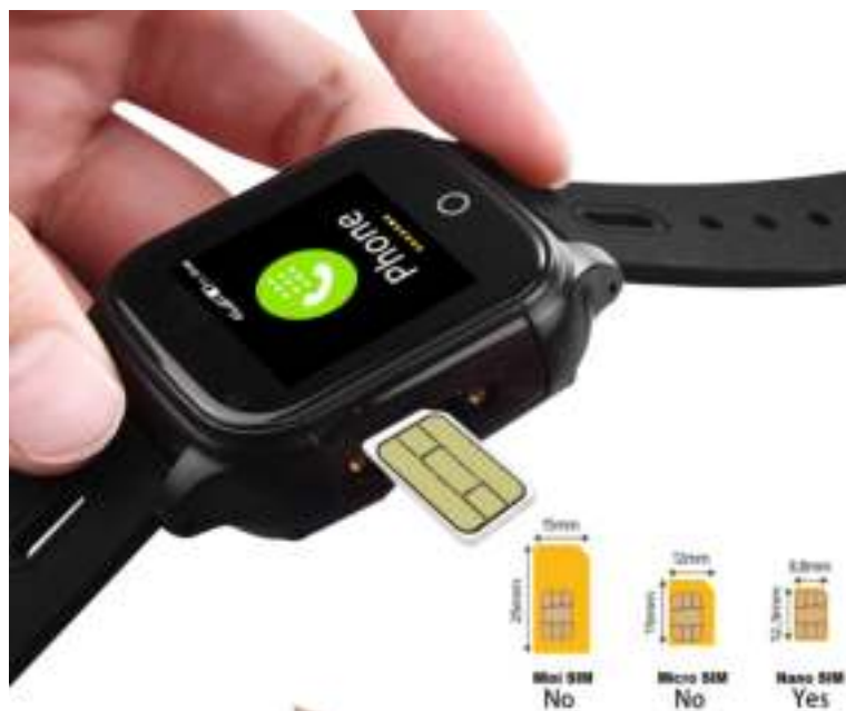
Nano simkaart = Kleinste simkaart formaat

Tijdens de opstartfase gaat het horloge zoeken naar beschikbare GSM en WIFI netwerken. De datum synchroniseert automatisch.