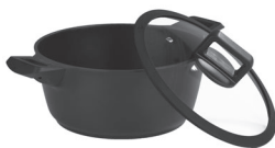
Pot with lid, Ø 24 cm Article number 02624