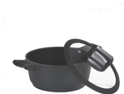
Pot with lid, Ø 20 cm Article number 02623