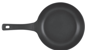
Poêle, Ø 28 cm Référence article 02622