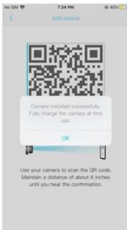
8. Camera is geïnstalleerd. Druk op OK