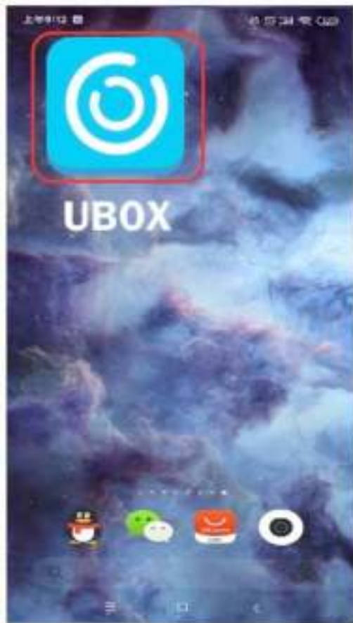
1. Download UBOX app