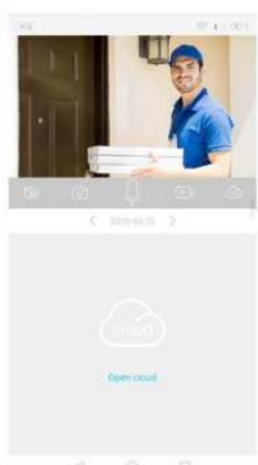
9. Veel plezier met de camera