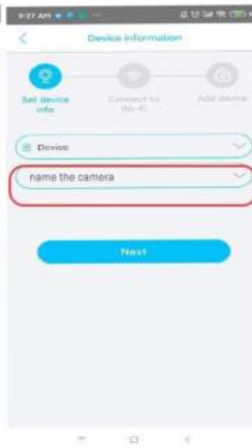
5. Geef de camera een naam