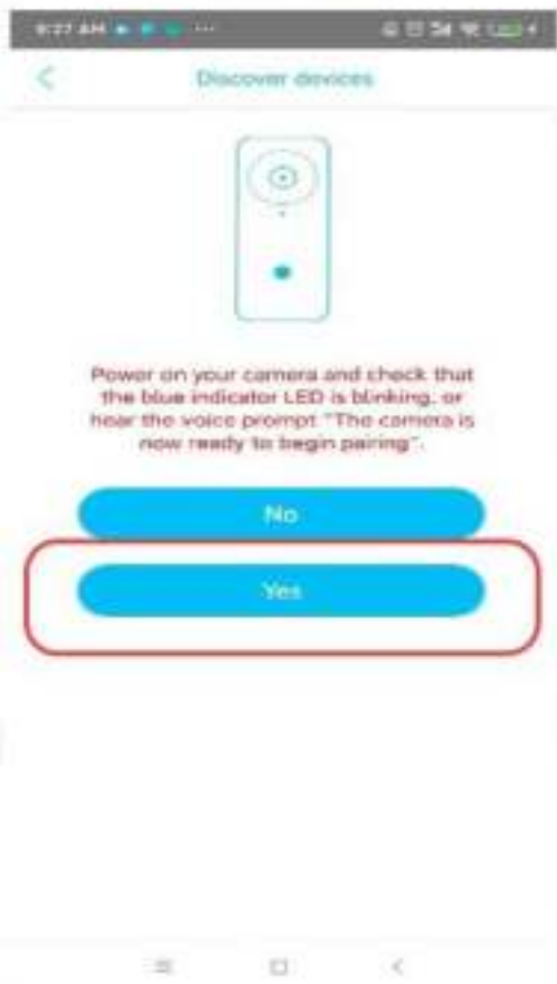
4. Als camera blauw wordt kies dan Yes