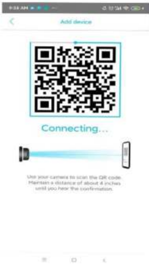
7. Laat de camera de QR code scannen