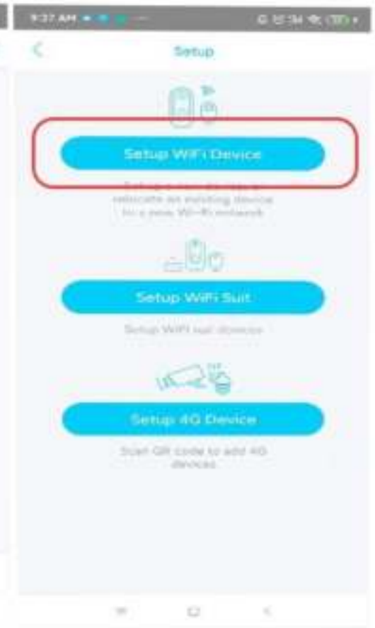
3. Kies Setup Wifi device