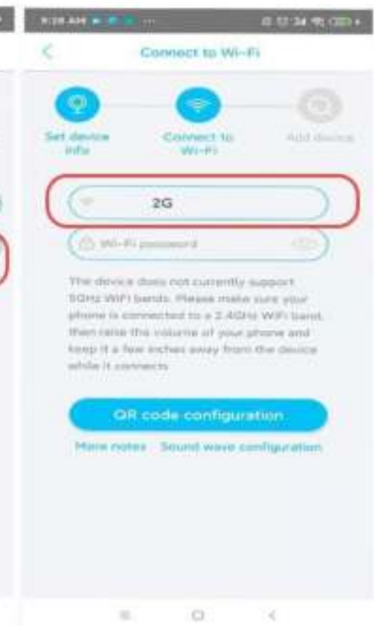
6. Kies Wifi en geef het wachtwoord op